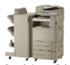
Sample Image Only