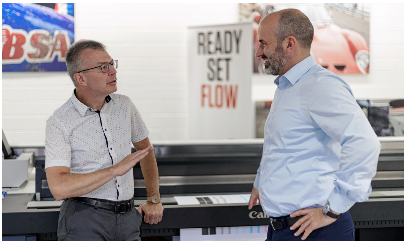
Des perspectives communes – Spandex AG et Canon (Suisse) SA

Pour les responsables de Spandex AG, outre la qualité élevée des produits, deux autres facteurs ont été déterminants dans la décision de rechercher une collaboration avec Canon Suisse. D'une part, il était important pour Spandex AG que Canon, en qualité de partenaire, propose des produits et des solutions dans le monde entier, car la propre activité commerciale de Spandex est orientée à l'international. D'autre part, Canon et Spandex poursuivent résolument une stratégie de durabilité.